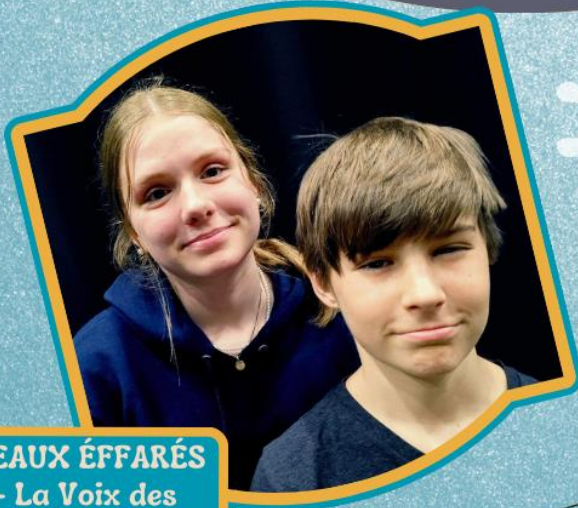
LES PANNEAUX ÉFFARÉS Artistes - La Voix des groupes ÎPÉ