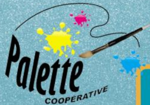
Les artistes de LA PALETTE

Encan silencieux et Loterie 50/50 au profit du Parc ABCD. Les dons seront aussi acceptés.